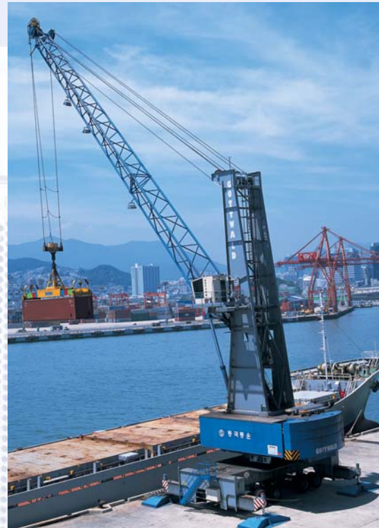
HMK 260 E der Gottwald Kran-95-Generation bei Dongkuk Transportation in Busan, Korea

Die neue Einheit wird vorab bei Gottwald konfiguriert und getestet. Dadurch kann der Austausch bei Kunden vor Ort in kürzester Zeit realisiert werden – sozusagen als Plug-&-Play-Lösung.