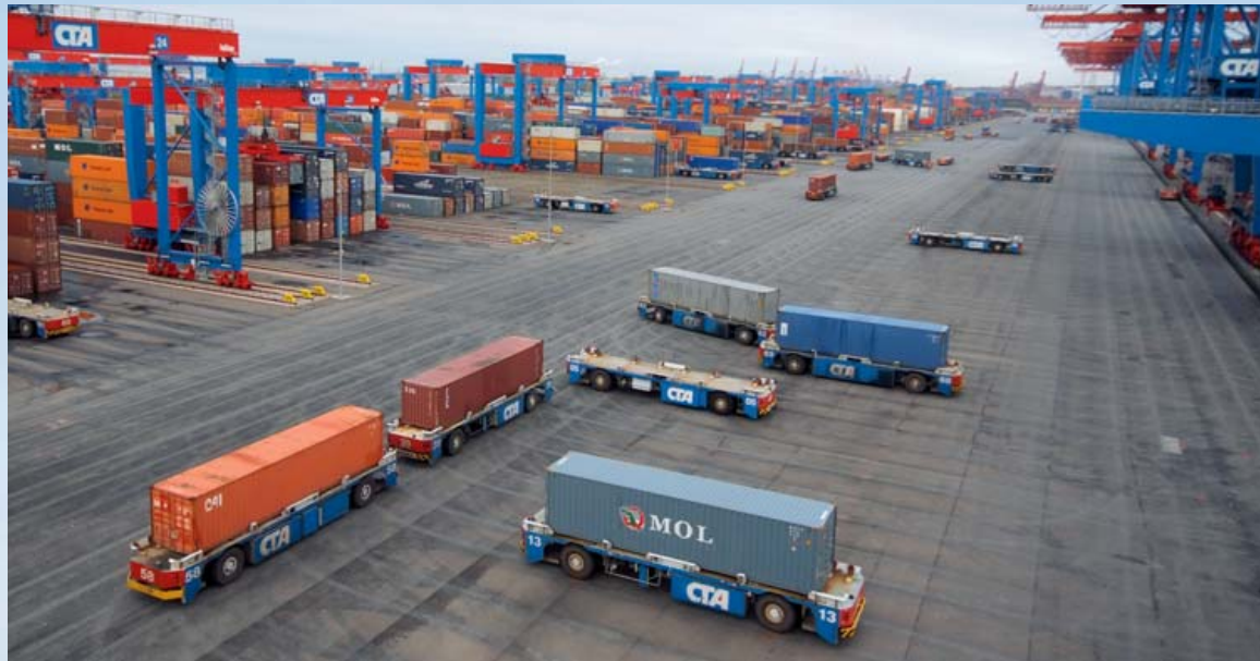
Flotten von ASC Automated Stacking Cranes (großes Foto) und AGV Automated Guided Vehicles können sowohl einzeln als auch im Verbund miteinander betrieben und zur Sicherung der Verfügbarkeit umfassend vom Gottwald Service versorgt werden