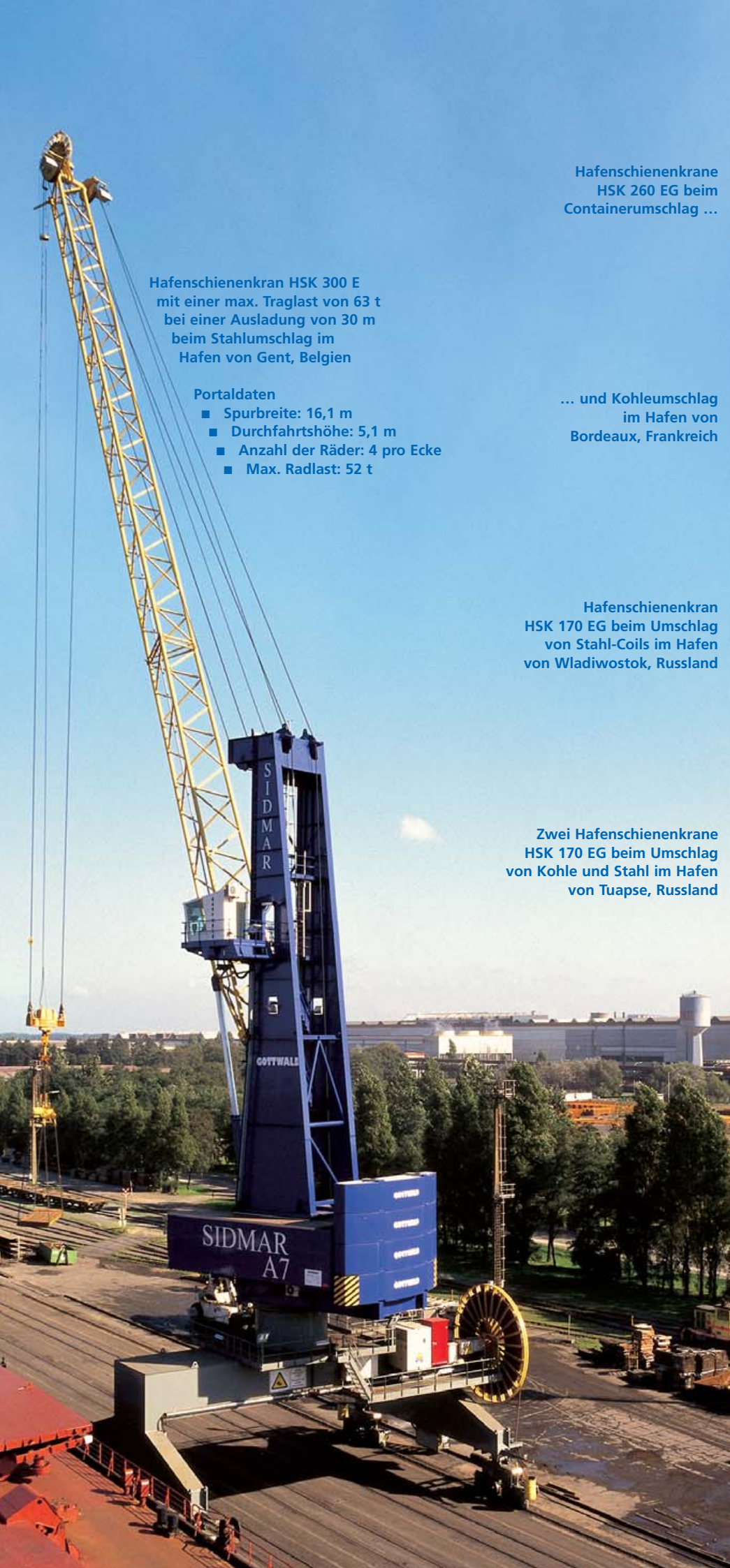
Hafenschienenkran HSK 300 E mit einer max. Traglast von 63 t bei einer Ausladung von 30 m beim Stahlumschlag im Hafen von Gent, Belgien