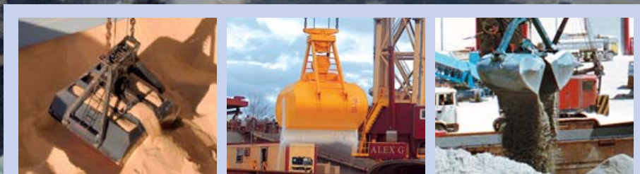
Gottwald Hafenschienenkrane schlagen Schüttgüter unterschiedlichster Art um, wie z.B. Kohle, Eisenerze, Kies, Sand, Zement, Klinker, Biomasse oder Futter- und Düngemittel

Die beiden Hafenschienenkrane bei Port of Tyne werden ausschließlich mit Energie aus dem Hafenstromnetz betrieben. Neben zuverlässigem und wirtschaftlichem Betrieb profitiert der Betreiber dabei von den Umweltaspekten der Gottwald Technologie, wie z.B. der Vermeidung von Abgasen und der Reduktion von Lärmmissionen.